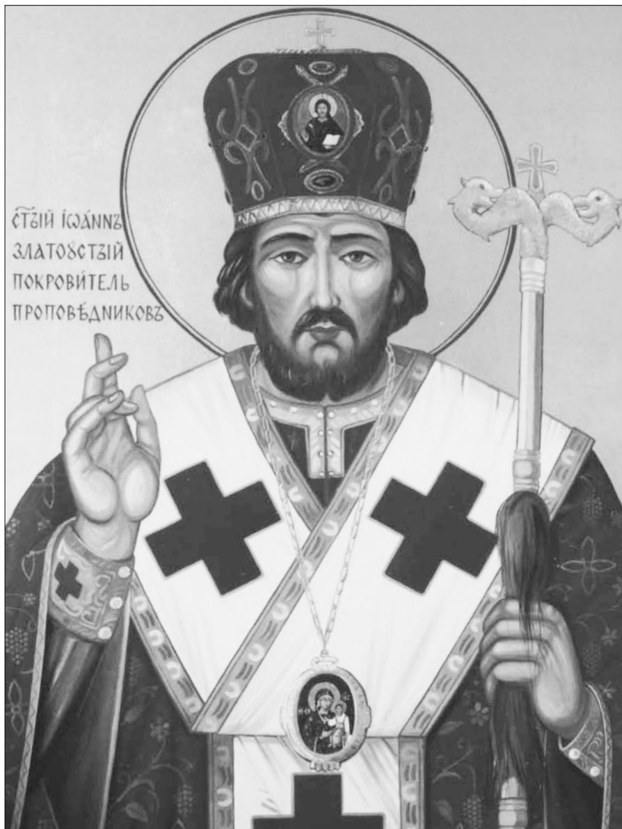
Sv. Ján Zlatouústy (347-407). Ikona (90x120 cm) sa nachádza v Monastyre sv. Bazila Velkého na Vajanského 31 v Prešove. Napísaná bola v roku 2002.