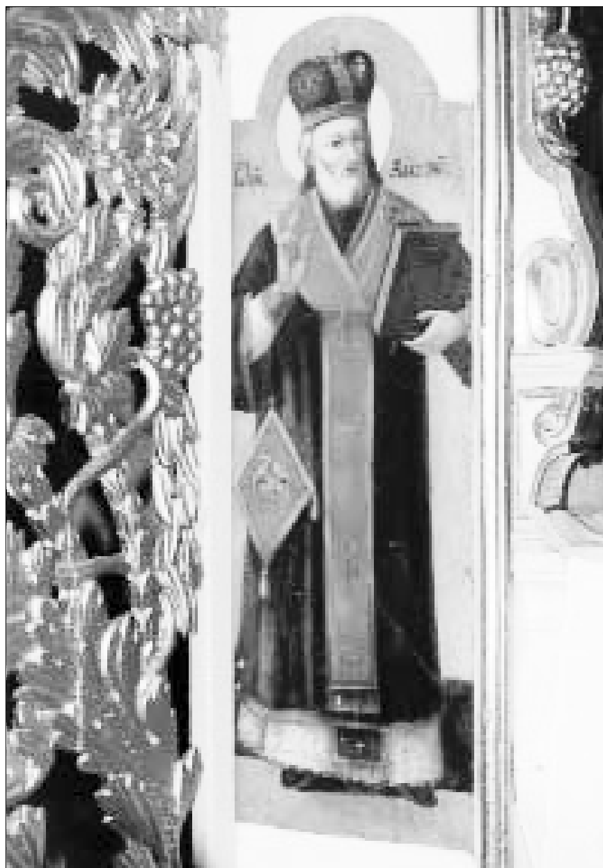
Svätý Ján Zlatouсты (+407) z ikonostasa baziliánskeho Bukovského monastyra na Bukovej Hore (okr. Stropkov). Ikona je z 18. storočia.