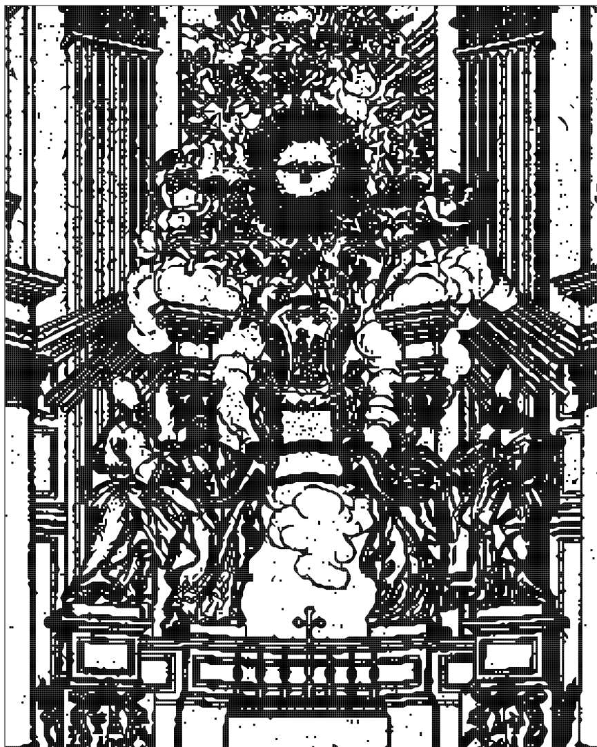
Berniniho súsošie v bazilike sv. Petra v Ríme. Štyria cirkevní Otcovia držia Petrov stolec. Dvaja z nich sú západní (v popredí) a dvaja východní: sv. Bazil Veľký a sv. Ján Zlatoústý (vzadu).