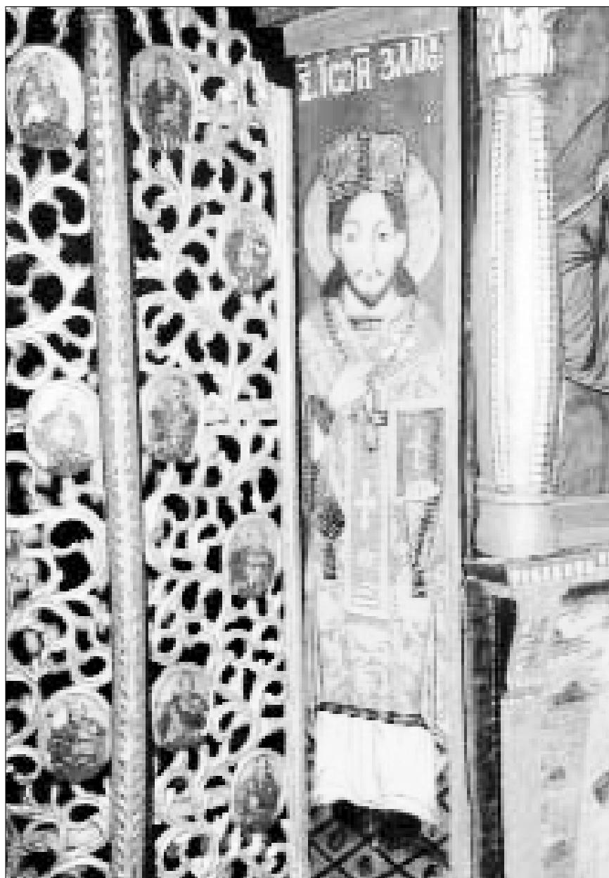
Svätý Ján Zlatoušty (+407) z ikonostasa gréckokatolíckej cerkvi v Uliči Krivom (okr. Snina). Ikona je zo 17. storočia.